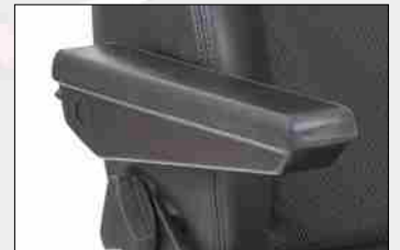
Pic. shows folding armrest

Optionally folding armrests can be ordered. The inclination of them can be adjusted by means of a rotary wheel.